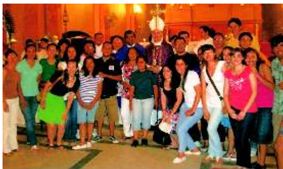
Equipo de Pastoral Juvenil NOA Santiago

Para el 2011 las propuestas apuntan a crear equipos de trabajo en la ciudad y el interior y evangelizar a los jóvenes desde la visión del humanismo cristiano a favor de la vida, teniendo por eje los la formación, la identidad, la espiritualidad y la misión, a través de medios atrayentes para el joven como el arte y el deporte. Otro objetivo importante es sostener las tradiciones típicas en relación a la religiosidad popular que caracteriza a Santiago del Estero para que las nuevas generaciones las conozcan y asuman como propias, con un significado nuevo de madurez de la fe y de su identidad como pueblo y como prioridad el entrar en dialogo con otras organizaciones.