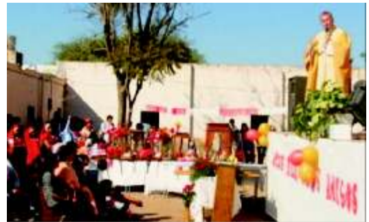
Mons. Torrado Mosconi celebró la Misa de la Festividad

La Fiesta finalizó con la realización de un desfile de jinetes y una gran celebración con un almuerzo comunitario.